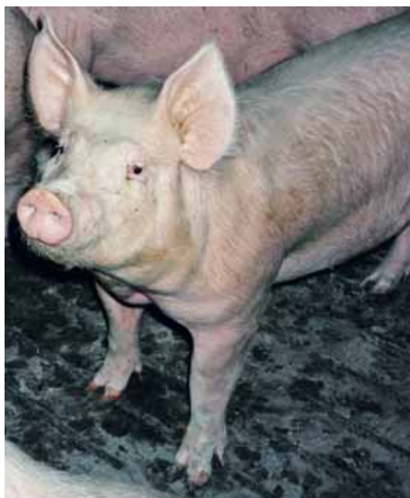
Nell'azienda in esame dal solo allevamento dei suini si ottiene un utile totale di stalla pari a 25 euro/capo

in un allevamento zootecnico al fine di valorizzare, da un punto di vista economico e ambientale, il potenziale energetico e fertilizzante degli effluenti, sottoponendoli a un insieme di processi di trasformazione in uscita dall'allevamento.