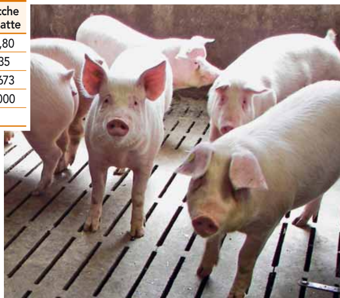
TABELLA 2 - Stima del numero di capi necessari ad alimentare un impianto di biogas in base alla potenza installata

Per alimentare un impianto di biogas da 100 kW sono necessari circa 8.000 suini da ingrasso